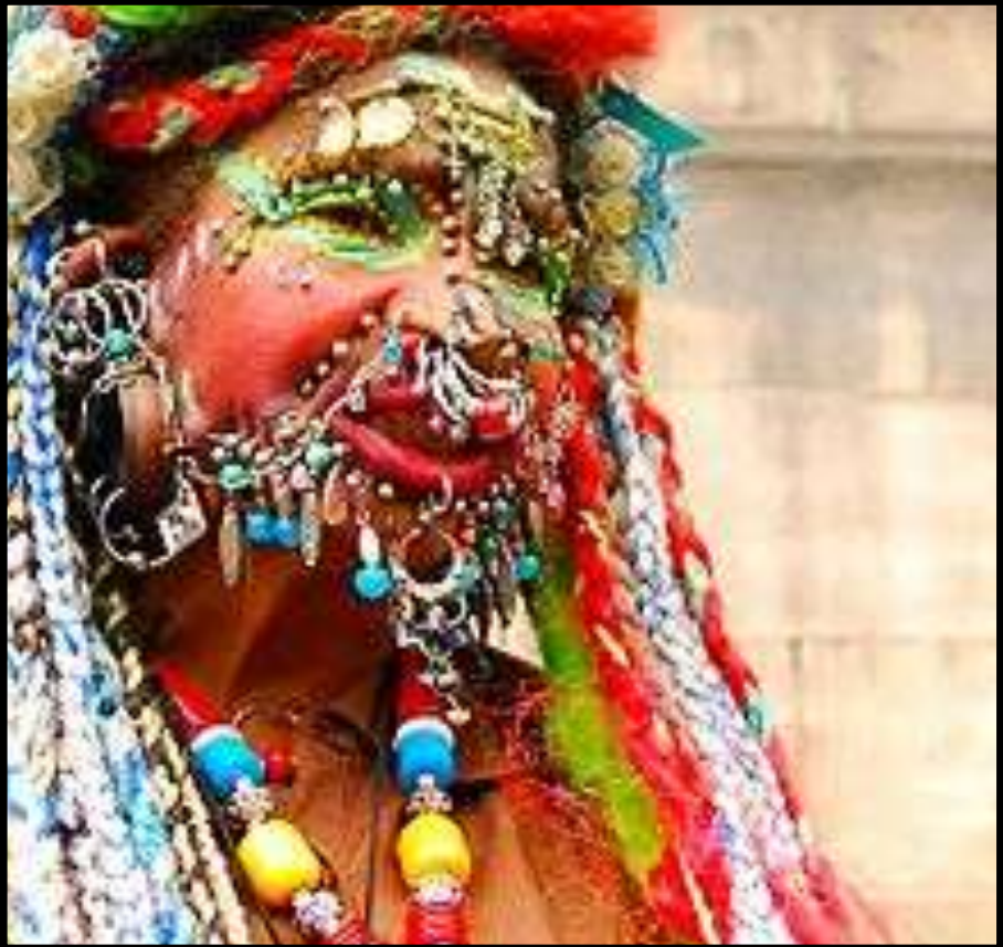
Elaine Davidson - Most pierced woman.

Lev 19:28 Julle mag ook ter wille van 'n dooie geen snye in julle vlees maak nie en geen ingeprikte tekening [tattoo's] in julle vel maak nie. Ek is die HERE.